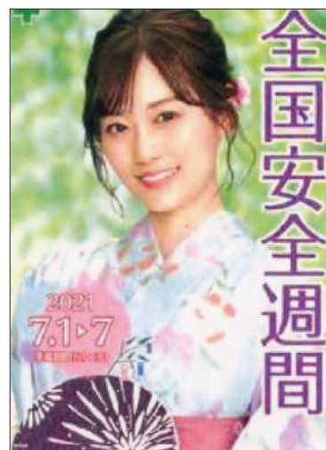
山下美月さんを起用したポスター

山下美月(やました みづき)さんのプロフィール=1999年7月、東京都生まれ。女性アイドルグループ乃木坂46メンバー。女性ファッション誌「Can Can」のモデルを務める。ファースト写真集「忘れられない人」が大ヒット。テレビ、映画、CMで大活躍中です。