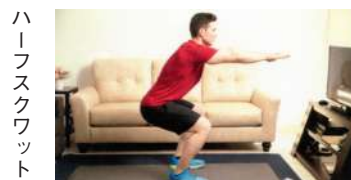
ハーフスクワット 2つの運動を1日6~10回